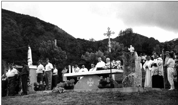
L'area che circonda la chiesa di Filippazzi con i monti della Concrena.